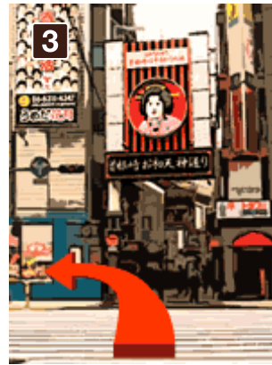
3 富国生命ビルを扇町通りに回り、うめだ花月側に向かう横断歩道を渡ります。