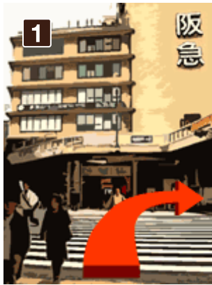
1 JR大阪駅御堂筋口を出て阪急百貨店側に向かう横断歩道を渡ります。