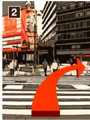
2 阪急百貨店側から HEPNAVIO 前の横断歩道を渡り、富国生命ビルに向かいます。